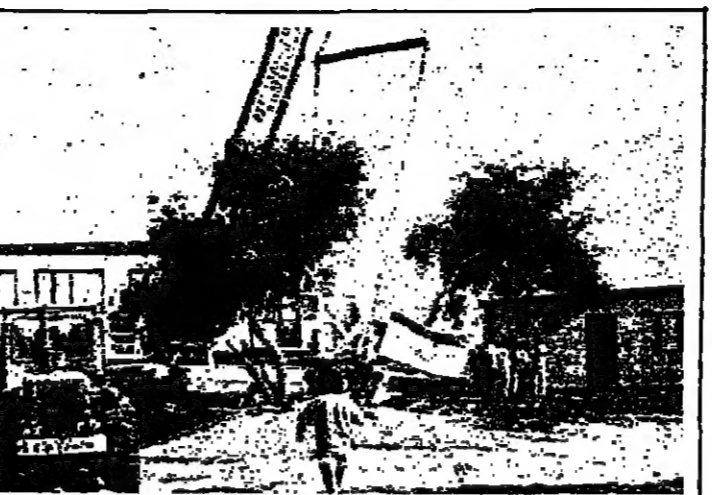
مستوطنون يمشون للساعات الأخيرة على مستوطنة صوغيت.

المرجحة السياسية والامنية على الساحة الداخلية. بما يوحي تراجع في الاعمال العسكرية. اصحت في المجال امام قدم الاتصالات السياسية في اتجاه الداخل اللبناني. وهي خطوط عربية واميركية وقتيانية اوروبية في اتجاه انهاء الماتق اللبناني عبر طرقات الافراج. في المنطقة الواقعة بين الرئيس العماد ميشال عون والسفيرة اللبنانية. الدكتور سمير جعجع. وفي المنطقة الغربية في اتجاه توسيع سلطة الرئيس الياس الهراوي. انطلاقا من تنفيذ اتفاق التفاح.